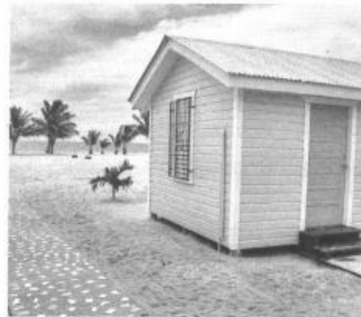
Cabane au bord de la mer