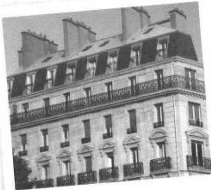
Appartement en centre-ville