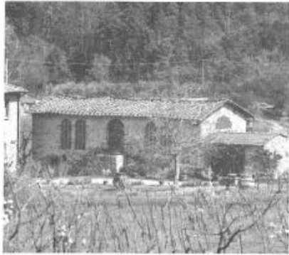
Maison à la campagne

Maison à la campagne ? Appartement en centre-ville ? Cabane au bord de la mer ? Chalet en montagne ? Quelle est l'habitation de vos rêves ? Décrivez-la à votre voisin(e).