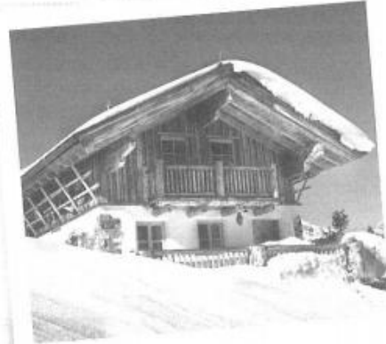
Chalet en montagne